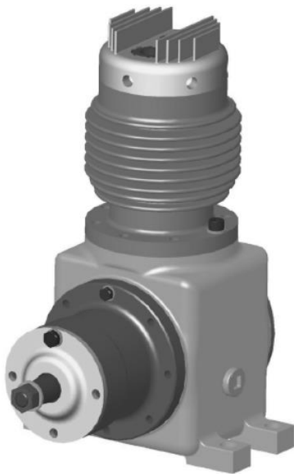
(a) Vue extérieure du compresseur.

Certaines machines utilisent de l'énergie pneumatique pour leurs actionneurs. Un micro-compresseur permet de fournir de l'air sous pression (de 5 à 8 bar). Il fonctionne généralement de façon intermittente. L'air sous pression est stocké dans un réservoir. Le compresseur est lui-même entraîné par un moteur électrique.